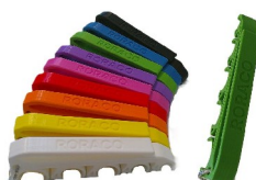
emh-547sb-541 Spritzenhalter MEDIHOLDER mit RORACO-Branding, Farbe Grün