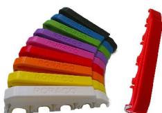
emh-547sb-651 Spritzenhalter MEDIHOLDER mit RORACO-Branding, Farbe Rot