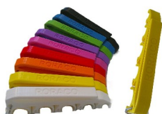
emh-547sb-572 Spritzenhalter MEDIHOLDER mit RORACO-Branding, Farbe Gelb