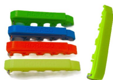
emh-547sb-570 Spritzenhalter MEDIHOLDER mit RORACO-Branding, Farbe Neongelb