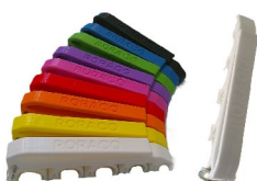
emh-547sb-901 Spritzenhalter MEDIHOLDER mit RORACO-Branding, Farbe Weiss