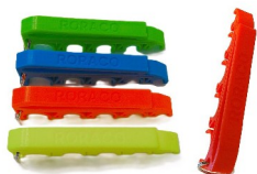
emh-547sb-590 Spritzenhalter MEDIHOLDER mit RORACO-Branding, Farbe Neonorange