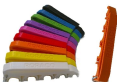
emh-547sb-594 Spritzenhalter MEDIHOLDER mit RORACO-Branding, Farbe Orange