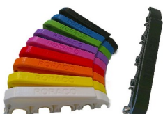
emh-547sb-941 Spritzenhalter MEDIHOLDER mit RORACO-Branding, Farbe Schwarz