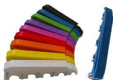
emh-547sb-474 Spritzenhalter MEDIHOLDER mit RORACO-Branding, Farbe Blau